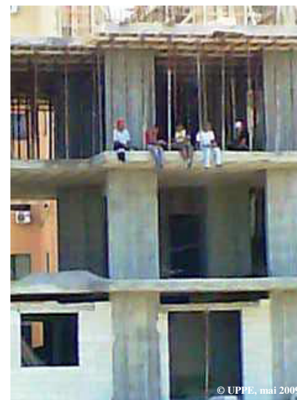
La pause déjeuner au 6 ème étage